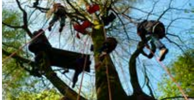
L'ARBRE À LUTIK