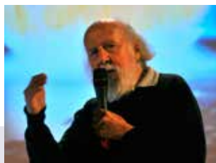
HUBERT REEVES