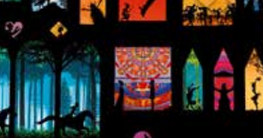
LES CONTES DE LA NUIT