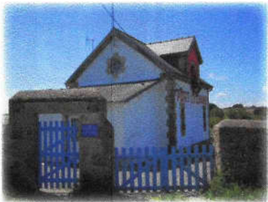
Maison-phare de Port-la-Chaîne

1 Arrivée par les chemins de traverse au rocher de Chabous. Ce promontoire offre une vue panoramique sur les grèves de Kermagen et Port-la-Chaîne. A l'ouest, vous apercevez notamment l'île Blanche, ancien cordon de galets accessible à marée basse. Attention aux marées ; respectez les oiseaux et l'environnement.