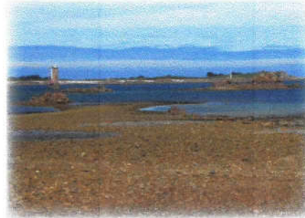
Le phare de la Corne et l'île d'Er depuis Port-Béni

Si vous trouvez des anomalies sur votre passage (absence de balisage, dégradations,...), merci de le signaler à l'office de tourisme.