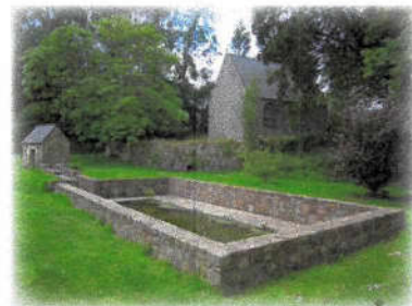
Chapelle et lavoir de Brestan

7 Chapelle Notre-Dame de Brestan (privée). Réédifiée en 1768-1769 sous la direction d'Yves Collen, maître maçon de Pleubian. Il y a inséré une pierre portant la date de 1652. Pendant la Révolution, les prêtres réfractaires y célébraient la messe.