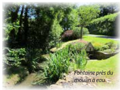
Fontaine près du moulin à eau.