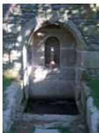
Fontaine près de la chapelle Notre-Dame de Traou Meur

♦ Si vous trouvez des anomalies sur votre passage (absence de balisage, dégradations,...), merci de le signaler à l'office de tourisme.