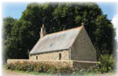
Chapelle Notre-Dame de Bonne Nouvelle

5 Ancien moulin à vent de Keraniou, aujourd'hui habité.