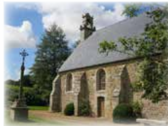
Chapelle de Kermassac'h

1 Chapelle de Kermassac'h. Le premier sanctuaire fut édifié en 1443 mais la fondation de la chapelle Notre-Dame de Kermassac'h date de 1463. Lors des guerres de la Ligue, l'armée anglaise basée à Bréhat accosta en 1592 sur l'île Castel Yar et combattit en cet endroit les ligueurs catholiques soutenus par les habitants de Lanmodez. Un vitrail de la chapelle raconte l'histoire de ce combat. En 1750, Cillart de la Villeneuve acheta la chapelle en ruine avec les terres qui en dépendaient et la reconstruisit en 1753.